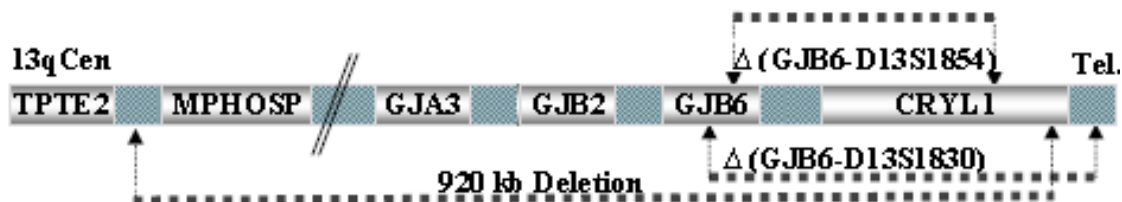
شکل ۱- محل حذف‌های ژنی بر روی کروموزوم ۱۳

هتروزیگوت مرکب بیماری ایجاد کند، وجود دارد. همچنین، در دو مطالعه‌ای که در جمعیت‌های ترک و کرد در کشور صورت گرفته، جهش (GJB6-D13S1830) Del در هیچ یک از افراد هتروزیگوت برای جهش GJB2 مشاهده نشده است (۱۸-۱۵) که با یافته‌های ما سازگاری دارد. جهش (GJB6-D13S1830) Del که شامل حذف ۳۴۲ kb از ژن GJB6 است، به صورت هموزیگوت و مستقل یا به صورت هتروزیگوت با جهش‌های ژن GJB2 در کشورهای اسپانیا، فرانسه، انگلیس، اسرائیل و برزیل با فراوانی زیاد و در جمعیت آمریکا، بلژیک و استرالیا با فراوانی کمتری مشاهده شده است. این جهش در کشورهای مثل چین (۱۹) و ترکیه (۲۰) مشاهده نشده است. جهش (GJB6-D13S1830) Del به عنوان دومین عامل ناشنوایی ارثی غیرسندرومی اتوزومی مغلوب بعد از جهش 35delG در ژن GJB2 در جمعیت اسپانیا مطرح شده است. این جهش در ۶۷٪ مواردی که جهش در ژن GJB2 را به صورت هتروزیگوت دارند، مشاهده شده است (۹). به نظر می‌رسد توارث دوژنی GJB6 و GJB2 در ایجاد ناشنوایی به این دلیل است که این دو ژن با یکدیگر در ساختمان گوش داخلی بیان می‌شوند و از نظر توالی آمینواسیدی ۷۷٪ با یکدیگر شباهت دارند (۲۱، ۴).