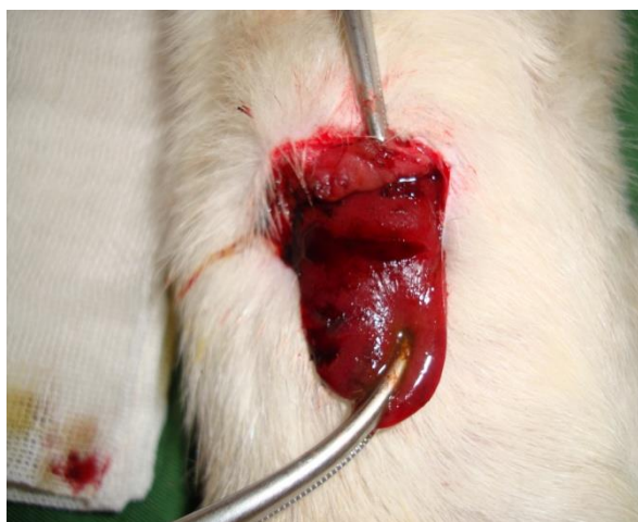
شکل ۲. کنترل خونریزی کبد با استفاده از کلسیم سولفات در رت نر نژاد ویستار

زمان هموستاز در این مطالعه، زمان مورد نیاز جهت خشک شدن کامل محل خونریزی و عدم ترشح خون از ناحیه برش در نظر گرفته شد. میانگین ده زمان به عنوان زمان هموستاز در آن غلظت در نظر گرفته شد. روش استاندارد جهت کنترل خونریزی کبد استفاده از بخیه می‌باشد. جهت مقایسه با روش استفاده از کلسیم سولفات، زمان مورد نیاز جهت برقراری هموستاز کبدی به وسیله روش بخیه زدن (کلیه بخیه‌ها توسط یک جراح زده شد) نیز بر روی یک گروه از رت‌ها که شرایط یکسانی از نظر اندازه برش بر روی کبد با گروه‌های دریافت کننده کلسیم سولفات داشتند، ثبت شد و میانگین ۱۰ زمان به عنوان زمان هموستاز با استفاده از روش بخیه در نظر گرفته شد و با نتایج حاصل از روش استفاده از کلسیم سولفات مورد مقایسه قرار گرفت. پس از کنترل خونریزی کبد،