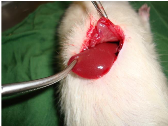
شکل ۱. برش در پوست و زیر جلد برای دسترسی به لوب کبدی در حفره شکمی رت نر نژاد ویستار

کلسیم سولفات از شرکت مرک آلمان (Merck, Darmstadt, Germany) خریداری شد و با استفاده از آب مقطر غلظت‌های ۰/۵۰٪، ۰/۲۵٪، ۰/۱۵٪، ۰/۱۰٪ و ۰/۵٪ از کلسیم سولفات تهیه شد. پس از ایجاد برش بر روی کبد با استفاده از سرنگ انسولین ۰/۵ میلی لیتر از محلول کلسیم سولفات در غلظت‌های ۰/۵۰٪، ۰/۲۵٪، ۰/۱۵٪، ۰/۱۰٪ و ۰/۵٪ روی محل برش در کبد هر رت ریخته شد، به طوری که از هر غلظت مورد نظر کلسیم سولفات بر روی یک گروه از رت‌ها استفاده شد. جهت تجویز حجم یکسان از غلظت‌های مختلف کلسیم سولفات از سرنگ انسولین استفاده شد و هر بار ۰/۵ میلی لیتر از هر غلظت با سرنگ بر روی محل خونریزی ریخته شد. با کرومومتر زمان هموستاز اندازه گیری و ثبت شد (شکل ۲).