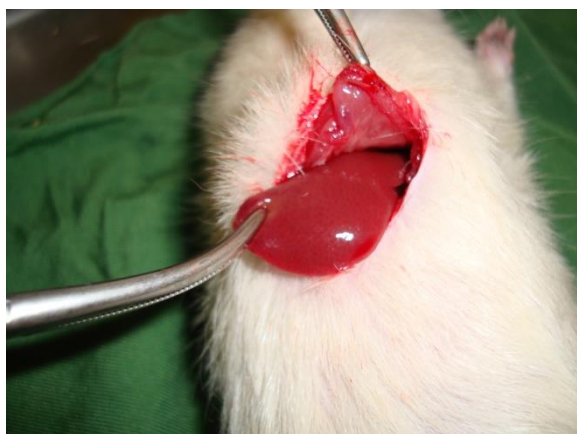
شکل ۱. برش در پوست و زیر جلد برای دسترسی به لوب کبدی در حفره شکمی رت نر نژاد ویستار

کلسیم سولفات از شرکت مرک آلمان (Merck, Darmstadt, Germany) خریداری شد و با استفاده از آب مقطر غلظت‌های ۰/۵۰٪، ۰/۲۵٪، ۰/۱۵٪، ۰/۱۰٪ و ۰/۵٪ از کلسیم سولفات تهیه شد. پس از ایجاد برش بر روی کبد با استفاده از سرنگ انسولین ۰/۵ میلی لیتر از محلول کلسیم سولفات در غلظت‌های ۰/۵۰٪، ۰/۲۵٪، ۰/۱۵٪، ۰/۱۰٪ و ۰/۵٪ روی محل برش در کبد هر رت ریخته شد، به طوری که از هر غلظت مورد نظر کلسیم سولفات بر روی یک گروه از رت‌ها استفاده شد. جهت تجویز حجم یکسان از غلظت‌های مختلف کلسیم سولفات از سرنگ انسولین استفاده شد و هر بار ۰/۵ میلی لیتر از هر غلظت با سرنگ بر روی محل خونریزی ریخته شد. با کرومومتر زمان هموستاز اندازه گیری و ثبت شد (شکل ۲).