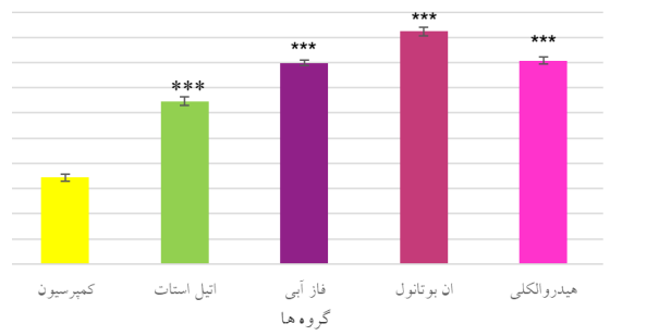
نمودار ۲- میزان دانسیته نورون‌های حرکتی آلفا شاخ قدامی نخاع بر حسب گروه‌ها

نتایج حاصل از برش‌های بافتی نخاع برای بررسی آلفا موتونورون‌های نخاع در نیمه راست شاخ قدامی در تصویرهای زیر خلاصه شده است. تصویر میکروسکوپی حاصل از برش عرضی قطعه‌های نخاعی عصب سیاتیک در گروه‌های مختلف و با رنگ‌آمیزی آبی تولوئیدین انجام گرفته است. الف: در گروه کنترل جسم سلولی آلفا موتونورون‌های شاخ قدامی نخاع به شکل منظم مشاهده می‌شود و هسته در مرکز قرار دارد. ب: کمپرسیون عصب سیاتیک سبب دژنراسیون مرکزی و تخریب جسم سلولی آلفا موتونورون‌های شاخ قدامی نخاع می‌شود. جسم سلولی به شکل بیضی و یا مثلثی در می‌آید. اجسام نیسل شکسته شده و در سرتاسر سیتوپلاسم پراکنده می‌شوند. همچنین هسته از موقعیت مرکزی خود به سمت محیط سلول