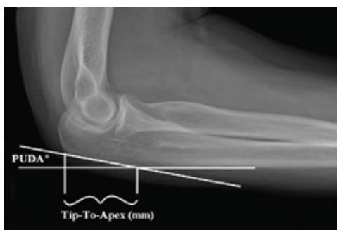
شکل ۳. اندازه‌گیری apex to tip

دادند که Tad میان مردان و زنان اختلاف معناداری را نشان داده و در مردان بیشتر است که این مطالعه‌ها با نتایج مقاله ما در رابطه با اختلاف Tad در بین مردان رابطه همسویی را نشان می‌دهد (۱۶). مطالعه‌های اجساد به دلیل محدودیت‌هایی که دارد جزئیات زیادی از آرنج را ارائه نمی‌دهد. همچنین اطمینان به اطلاعات به دست آمده از آرنج اجساد نیز جای سوال دارد. استفاده از تصاویر سی تی اسکن در برخی اجساد ممکن است اطلاعات مفیدی را ارائه دهد. با این حال اطلاعات حاصله از تصاویر رادیوگرافی همانند تصاویر MRI قابل اعتمادتر هستند (۱۳). استفاده‌های نادرست از پروگسیمال اولنا می‌تواند به جابه‌جایی سر اولنا، در رفتگی‌های مفصل رادیو اولنار و چرخش‌های غیر طبیعی ساعد منجر شود. از این رو بازسازی پروگسیمال اولنا بعد از استئوتومی و شکستگی‌ها به عنوان مهم‌ترین معیار برای جراحی‌های ارتوپدی ناحیه اولناست. نازک‌تر شدن پروگسیمال اولنا می‌تواند در نهایت به خرد شدن و شکستگی سر اولنا منجر شده و تداخل در مفصل رادیو اولنار ایجاد کرده و چرخش ساعد را با مشکل مواجه کند.