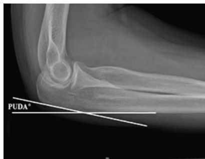
شکل ۲. اندازه‌گیری زاویه پستی پروگسیمال اولنا