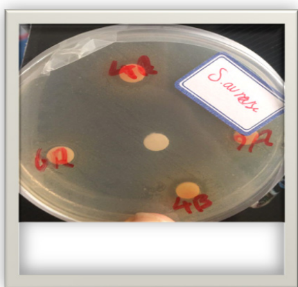
شکل ۲: بررسی اثر بازدارندگی گونه های مختلف لاکتوباسیلوس علیه باکتری استافیلوکوکوس اورئوس به روش انتشار در آگار