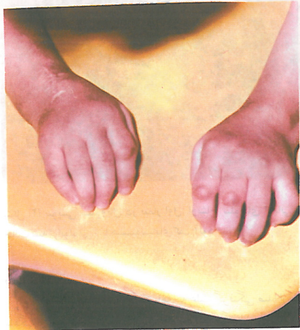
شکل ۳) بیمار دوم. تغییر شکل مفاصل دست همراه با ندولهای زیرجلدی اطراف و روی مفاصل

اندازه نخود یا بزرگتر حس می شود که متحرک و بدون درد می باشند. این ندولها در اطراف و روی سایر مفاصل نیز بچشم می خورند.