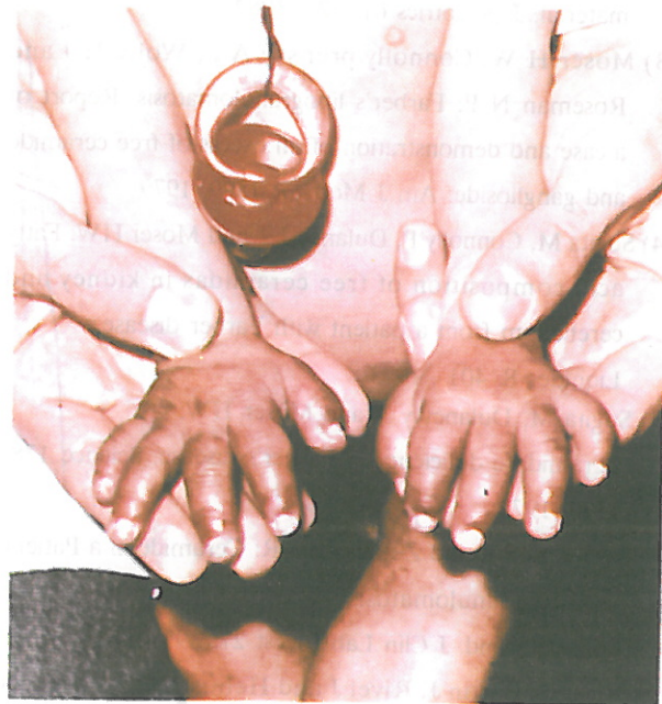
شکل ۱) بیمار اول ج.ع تورم دستها توأم با دوکی شدن آنها

تکه برداری از کبد دگر دسی (متامورفوز) چربی را نشان می‌دهد. تکه برداری از پوست واسکولیت لکوسیتو کلاستیک را گزارش کرد. تکه برداری سینوویال ارتشاح سلولهای التهابی مزمن بیشتر از نوع لنفوسیت، هیستوسیت با چند سلول ژان که حالتی شبه‌گرانولوم پیدا کرده در زیر سینوویال و اطراف عروق به چشم می‌خورد. در لابلاهی الیاف عضلانی نیز این ارتشاح بانکروز و صغر فیبرهای عضلانی مشاهده می‌گردد. در رنگ آمیزی اختصاصی هیستوسیتها پاس مثبت و سودان سیاه مثبت بودند. یافته‌های فوق با بیماری فاربر کاملاً مطابقت دارد.