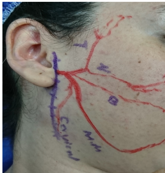
طراحی سطحی برش جراحی و شاخه‌های عصب فاسیال قبل پاروتیدکتومی راست

گزارش مورد متاستاز ملانوم به غده پاروتید در مطالعات انگلیسی زبان اغلب به صورت یک طرفه و با رشد سریع و در افراد مسن بوده است. نخستین مورد توسط Cengiz و همکاران (۲۲) در سال ۲۰۱۶ گزارش شده که بیمار مردی ۷۸ ساله با سابقه ملانوم پیشانی بوده که دچار توده دوطرفه غیرقرینه با رشد سریع در غدد پاروتید شده است. بعد اکسیژن توده‌ها و بررسی پاتولوژی و IHC متاستاز ملانوم به هر دو غده پاروتید مشخص شده است. در بیمار گزارش شده در مقاله حاضر متاستاز ملانوم به غدد پاروتید به صورت طرفه، همزمان و با رشد آهسته بوده و در یک بیمار جوان اتفاق افتاده است.