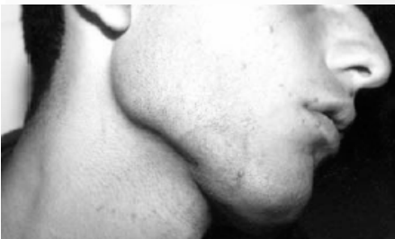
شکل ۱- تینه آ گلاادیاتوروم ایجاد شده به وسیله تریکوفایتون تونسورانس در کشتی‌گیران

جنس تریکوفایتون‌ها ایجاد می‌شود. قارچ معمولاً ضایعه‌ای با مرکز روشن و حاشیه مشخص، پوسته‌دار و خشن ایجاد می‌کند. ضایعات از نظر اندازه متغیر و از ضایعات گرد بسیار کوچک تا بزرگ را تشکیل می‌دهند.