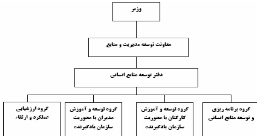
نمودار ۳- ساختار دفتر توسعه منابع انسانی