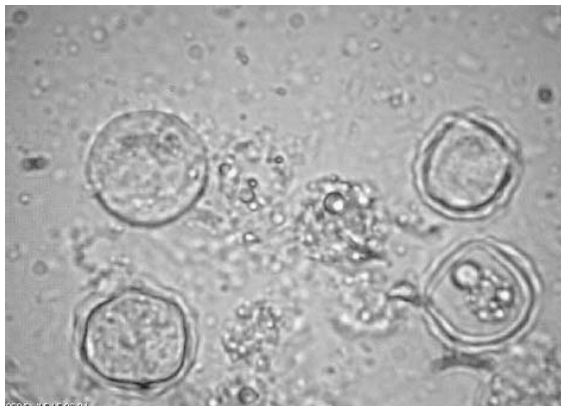
شکل ۱- کیست آکانتامبا جدا شده از آب راکد (بزرگنمایی 400X)

از مجموع ۲۲ نمونه جمع‌آوری شده از آب‌های سطحی راکد در سطح شهر تهران، ۱۳ نمونه (۵۹/۱ درصد) در کشت Monoxenic از لحاظ شکل ظاهری کیست‌های به دست آمده، آمیب آزادی آکانتامبا تشخیص داده شدند (شکل ۱).