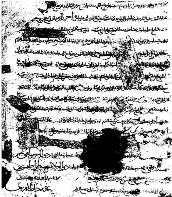
شکل ۳- صفحه آخر ترجمه مهران بن منصور که در کتابخانه آستان قدس رضوی مشهد نگهداری می‌شود.

این نسخه مورد توجه بسیاری از بازدیدکنندگان قرار گرفته و یکی از دانشمندان معاصر یعنی دکتر صلاح الدین المنجد، رئیس انجمن جهانی زبان و ادبیات عرب، که در سال ۱۳۳۹ هجری شمسی از کتابخانه آستان قدس رضوی بازدید نموده، گفته است: «در سال ۱۹۶۰ میلادی، ضمن بازدید از کتابخانه امام علی بن موسی الرضا (ع) نسخه خطی بسیار ارزشمند و کم‌نظیری از کتاب دیسقوریدس را یافتم که به زبان عربی در قرن هفتم هجری نوشته شده و شامل تصاویر گیاهانی است که مورد بحث قرار گرفته‌اند. هیچ یک از دانشمندان، تا کنون این کتاب را نشناخته و حتی نام آن در فهرست کتابهای نفیس خطی هم چاپ نشده است...» (۴). وی تأکید کرده که این ترجمه از نظر کیفیت و صحت، بر ترجمه اصطفی و حنین برتری چشم‌گیری داشته و آرزو کرده که روزی چاپ و منتشر شود. البته نسخه خطی دیگری از همین ترجمه در کتابخانه موزه گلستان تهران نگهداری می‌شود که به خط بسیار خوبی نوشته شده، مزین به تصاویر رنگی بسیار زیبایی است و در سال