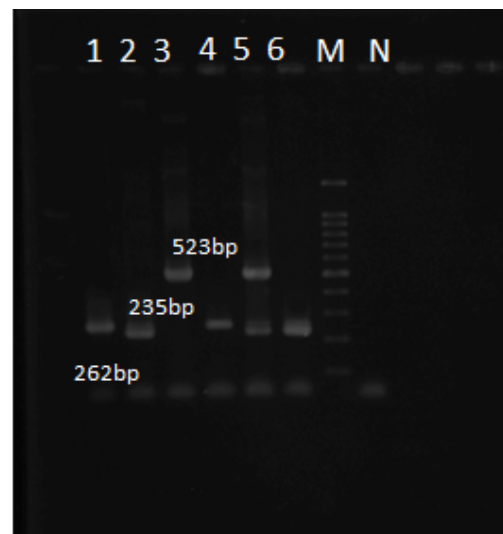
تصویر شماره ۱: تصویر الکتروفورس ژن‌های تکثیر شده روی ژل آگارز M: مارکر ۱۰۰، BP، ۱ و ۲ و ۳ کنترل‌های مثبت، N: کنترل منفی، ۵: نمونه‌های مثبت بیماران

تحقیق نشان داد که میزان رشد و تشخیص باکتری‌های سخت رشد در روش‌های بررسی شده اختلاف معنادار داشته‌اند ( p < 0/05 ). به وسیله روش کشت ۳ ایزوله (۶درصد) آلبیوس اوتیتیدیس، ۳ ایزوله (۶درصد) هموفیلوس آنفلوانزا و یک ایزوله (۲درصد) موراکسلا کاتارالیس جداسازی شد. بیشترین باکتری شناسایی شده در این مطالعه به وسیله PCR هموفیلوس آنفلوانزا با ۲۸ ایزوله (۵۶درصد) و سپس آلبیوس اوتیتیدیس با ۲۵ مورد (۵۰درصد) و تعداد موارد شناسایی شده موراکسلا کاتارالیس ۱۱ مورد (۲۲درصد) بود. نتایج به دست آمده نشان می‌دهد که روش Multiplex PCR روشی دقیق‌تر و حساس‌تر برای شناسایی باکتری‌های مورد مطالعه است.