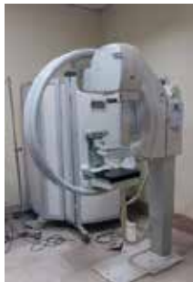
شکل ۱: دستگاه ماموگرافی معمولی مدل Giatto image

دستگاه‌های ماموگرافی استفاده شده در این مطالعه از نوع دیجیتالی و معمولی بودند که نوع معمولی آن با برند Giotto Image ساخت کارخانه IMS ۶ کشور ایتالیا و Palanmed است که تصویر آن را در شکل شماره ۱ مشاهده می‌کنید (IMS company).