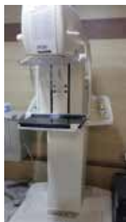
شکل ۲: دستگاه ماموگرافی دیجیتال Planmed

همچنین در این مطالعه از دستگاه تصویربرداری ماموگرافی دیجیتالی مدل Brestige ساخت شرکت MEDI FUTURE ۷ کشور کره جنوبی نیز استفاده شد. تصویر دستگاه ماموگرافی برستيج را در شکل زیر مشاهده می‌کنید (شکل شماره ۳).