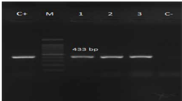
شکل ۳- الکتروفورز محصول PCR روی ژل آگارز برای ژن‌های M: Ladder 100-bp - C+: pvl: سویه استاندارد کنترل مثبت - C-: کنترل منفی - نمونه ۳ تا ۱: ژن ۳ تا ۱ (طول قطعه ۴۳۳ bp)

اورئوس مقاوم به متی‌سیلین و سویه‌های حساس به متی‌سیلین مشاهده نشد توزیع فراوانی هر یک از ژن‌های بررسی شده با استفاده از روش PCR، نشان داد که تعداد ۳۰ ایزوله دارای ژن mec-A ، ۶ ایزوله دارای ژن PVL و ۹۵ نمونه دارای ژن hlg . همچنین همه ایزوله‌های استافیلوکوکوس اورئوس مقاوم و حساس به متی‌سیلین دارای ژن nuc باشد. در مطالعه حاضر، ۴ سویه MSSA و ۲ سویه MRSA دارای ژن PVL بودند. ارتباط معنا داری بین وجود ژن PVL با سویه های MRSA و MSSA به دست نیامد ( p\text{-value} = 0.58 ).