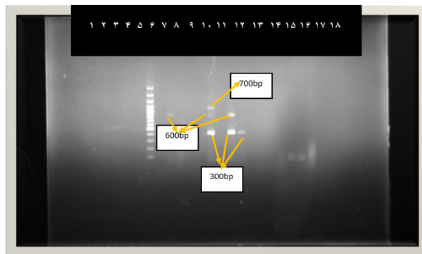
شکل ۴: باند ژن خاصیت ضد میکروبی لاکتوباسیلوس اجلیس

بر اساس باندهای تشکیل شده از ۱۸ نمونه باکتری در این ژل که با پرایمر اختصاصی باکتریوسین لاکتوباسیلوس اجلیس (M۱۳ CP۰۱۶۷۶۶) بود، ۲۲/۲ درصد از باکتری‌ها باکتری از نظر حضور ژن مثبت بودند. شماره ۱: لاکتوباسیلوس پلانتاروم، شماره ۲: لاکتوباسیلوس پلانتاروم، شماره ۳: لاکتوباسیلوس کنکئی، شماره ۴: لاکتوباسیلوس پلانتاروم، شماره ۵: لاکتوباسیلوس پلانتاروم، شماره ۶: لاکتوباسیلوس نجلی، شماره ۷: مارکر، شماره ۸: لاکتوباسیلوس مالی، شماره ۹: لاکتوباسیلوس اجلیس، شماره ۱۰: لاکتوباسیلوس پنتیس، شماره ۱۱: لاکتوباسیلوس پلانتاروم، شماره ۱۲: لاکتوباسیلوس گاستریکوس، شماره ۱۳: لاکتوباسیلوس اجلیس. شماره ۱۴: لاکتوباسیلوس کازئی، شماره ۱۵: لاکتوباسیلوس اجلیس، شماره ۱۶: لاکتوباسیلوس اجلیس، شماره ۱۷: لاکتوباسیلوس پلانتاروم، شماره ۱۸: لاکتوباسیلوس سالیاریوس. با توجه به مارکر، اندازه باندهای مشاهده شده ۳۰۰ bp و ۶۰۰ bp و ۷۰۰ bp بودند.