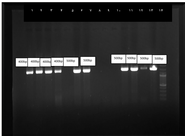
شکل ۳: باند ژن خاصیت ضد میکروبی لاکتوباسیلوس ها شماره ۱: لاکتوباسیلوس پلانتروم، شماره ۲: لاکتوباسیلوس پلانتروم، شماره ۳: لاکتوباسیلوی کنکی، شماره ۴: لاکتوباسیلوس پلانتروم، شماره ۵: لاکتوباسیلوس پلانتروم، شماره ۶: لاکتوباسیلوس نجلی، شماره ۷: لاکتوباسیلوس اجلیس، شماره ۸: لاکتوباسیلوس مالی، شماره ۹: لاکتوباسیلوس اجلیس، شماره ۱۰: لاکتوباسیلوس پنتریس، شماره ۱۱: لاکتوباسیلوس پلانتروم، شماره ۱۲: لاکتوباسیلوس گاستریکوس، شماره ۱۳: لاکتوباسیلوس اجلیس. شماره ۱۴: مارکر. اندازه باندهای تشکیل شده حاصل از PCR، ۵۰۰ bp و ۴۰۰ bp بودند.