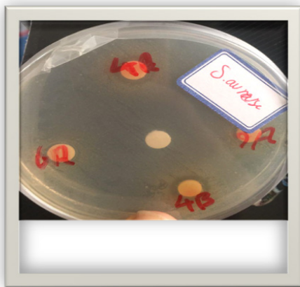
شکل ۲: بررسی اثر بازدارندگی گونه های مختلف لاکتوباسیلوس علیه باکتری استافیلوکوکوس اورئوس به روش انتشار در آگار