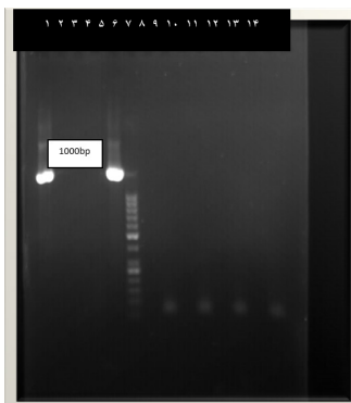
شکل ۵: باند ژن خاصیت ضد میکروبی لاکتوباسیلوس پلانتاروم

بر اساس باندهای تشکیل شده از ۱۸ نمونه باکتری در این ژل که با پرایمر اختصاصی باکتریوسین لاکتوباسیلوس اجلیس (M۱۳ CP۰۱۶۷۶۶) بود، ۲۲/۲ درصد از باکتری‌ها باکتری از نظر حضور ژن مثبت بودند. شماره ۱: لاکتوباسیلوس پلانتاروم، شماره ۲: لاکتوباسیلوس پلانتاروم، شماره ۳: لاکتوباسیلوس کنکئی، شماره ۴: لاکتوباسیلوس پلانتاروم، شماره ۵: لاکتوباسیلوس پلانتاروم، شماره ۶: لاکتوباسیلوس نجلی، شماره ۷: مارکر، شماره ۸: لاکتوباسیلوس مالی، شماره ۹: لاکتوباسیلوس اجلیس، شماره ۱۰: لاکتوباسیلوس پنتیس، شماره ۱۱: لاکتوباسیلوس پلانتاروم، شماره ۱۲: لاکتوباسیلوس گاستریکوس، شماره ۱۳: لاکتوباسیلوس اجلیس. شماره ۱۴: لاکتوباسیلوس کازئی، شماره ۱۵: لاکتوباسیلوس اجلیس، شماره ۱۶: لاکتوباسیلوس اجلیس، شماره ۱۷: لاکتوباسیلوس پلانتاروم، شماره ۱۸: لاکتوباسیلوس سالیاریوس. با توجه به مارکر، اندازه باندهای مشاهده شده ۳۰۰ bp و ۶۰۰ bp و ۷۰۰ bp بودند.