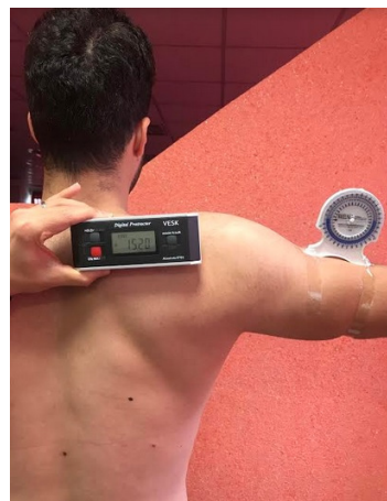
شکل ۱. تصویری از نحوه اندازه‌گیری چرخش بالایی کتف و ابداکشن ۹۰ درجه بازو

برای اندازه‌گیری دامنه حرکتی بازو و کتف از اینکلینومتر استفاده شد (۹۱/۸۶/۰/۸۶ = ICC). ریتیم اسکاپولوهورمال از تقسیم ابداکشن بازو بر چرخش بالایی کتف در زوایای ۴۵، ۹۰، ۱۳۵، ۱۷۰ تا ۹۰ و از ۹۰ تا ۱۳۵ درجه ابداکشن شانه در صفحه فرونتال محاسبه شد (۱۷). در این مطالعه برای بررسی ریتیم اسکاپولوهورمال از دو اینکلینومتر استفاده شد. یک اینکلینومتر برای اندازه‌گیری میزان الویشن شانه و اینکلینومتر دیگر برای اندازه‌گیری میزان چرخش بالایی کتف استفاده شد. در ابتدا از آزمودنی خواسته می‌شد تا بدون کفش و فاصله پاها به اندازه عرض شانه بایستد. مفصل آرنج در حالت اکستنشن کامل بود و دست‌ها در کنار بدن (روی قسمت خارجی ران) قرار می‌گرفت. اینکلینومتر اول به‌طور عمودی به‌طور دقیق روی برجستگی دالی (محل اتصال سر متحرک عضله دلتوئید) با استفاده از یک نوار به بازو متصل شده بود. اینکلینومتر دوم روی خارکتف قرار می‌گرفت. از آزمودنی خواسته می‌شد تا به‌طور فعال ابداکشن بازوی برتر را انجام دهد و در ۹۰ و ۱۳۵ درجه ابداکشن شانه نگه دارد (شکل ۱). پوزیشن استراحت کتف در وضعیتی که دست‌ها در کنار بدن بود (میزان چرخش بالایی/ پایینی) با استفاده از اینکلینومتر دوم اندازه‌گیری می‌شد (۱۷). ریتیم اسکاپولوهورمال از تقسیم کردن میزان ابداکشن شانه بر چرخش بالایی کتف محاسبه می‌شد (۱۷). آزمودنی حرکت را در