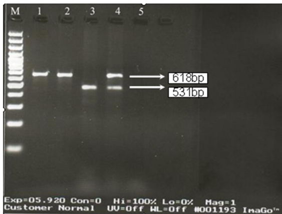
شکل ۲. نتایج الکتروفورز ژل آگارز برای Multiplex PCR. ژن TEM و DHA: M: مارکر ۱۰۰ bp. ۱: کنترل مثبت (کلبسیلا پنومونیه ۱۸۱) برای TEM، ۲: جدایه شیر مثبت برای TEM، ۳: جدایه شیر مثبت برای DHA، ۴: جدایه شیر مثبت برای TEM و DHA، ۵: کنترل منفی

حاله به اندازه پنج میلی‌متر یا بیشتر در اطراف دیسک سفتازیدیم-کلاوولانیک اسید و یا سفوتاکسیم-کلاوولانیک مشخص شد. از طرفی به پیشنهاد CLSI، جدایه‌هایی که در تست فنوتیپی تأییدی اثر بتالاکتامازها در آن‌ها به وسیله مهارکننده بتالاکتامازی مهار نمی‌شود، بالقوه به عنوان مولد AmpC بتالاکتاماز محسوب می‌شوند.