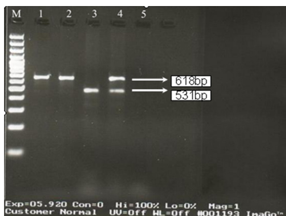
شکل ۲. نتایج الکتروفورز ژل آگارز برای Multiplex PCR. ژن TEM و DHA: مارکر ۱۰۰ bp. ۱: کنترل مثبت (کلبسیلا پنومونیه ۱۸۱) برای TEM، ۲: جدایه شیر مثبت برای TEM، ۳: جدایه شیر مثبت برای DHA، ۴: جدایه شیر مثبت برای TEM و DHA، ۵: کنترل منفی

حاله به اندازه پنج میلی‌متر یا بیشتر در اطراف دیسک سفتازیدیم-کلاوولانیک اسید و یا سفوتاکسیم-کلاوولانیک مشخص شد. از طرفی به پیشنهاد CLSI، جدایه‌هایی که در تست فنوتیپی تأییدی اثر بتالاکتامازها در آن‌ها به وسیله مهارکننده بتالاکتامازی مهار نمی‌شود، بالقوه به عنوان مولد AmpC بتالاکتاماز محسوب می‌شوند.