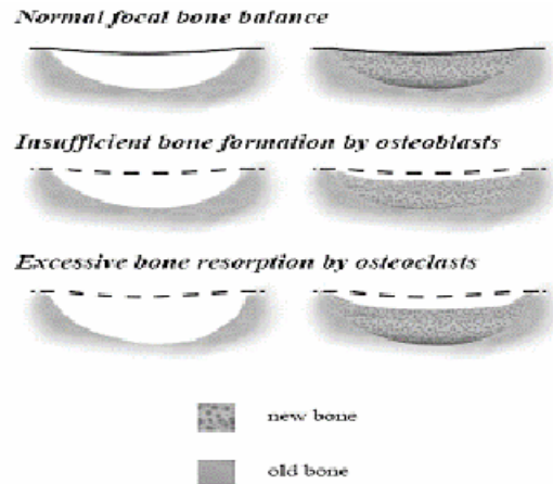
شکل ۲- دو مکانیسم بهم خوردن تعادل در بازسازی استخوانی

کاهش فعالیت غدد جنسی اهمیت زیادی دارد، بطوری که ۲۰٪ بیماران که دچار شکستگی مهره علامت‌دار و ۵۰٪ کسانی که شکستگی هیپ دارند، از این بیماری رنج می‌برند (۱۴). مطالعات نشان می‌دهد BMD و شیوع شکستگی مهره در مردها با سطح سرمی استرادیول مرتبط است نه سطح تستوسترون (۱۵، ۱۶). بنابراین استرادیول هورمون جنسی غالب در تنظیم جذب استخوان در مردها به شمار می‌رود (شکل ۳) (۱۷).