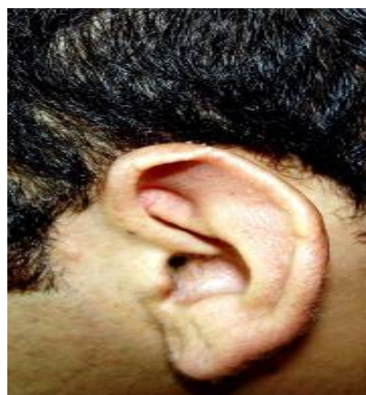
شکل (۲) اسکار و خوردگی ناحیه لاله گوش