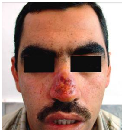
شکل (۱) ضایعات اروزیو ناحیه بینی

ارزیابی ضایعات اروزیو همراه اسکار در نواحی در معرض نور به ویژه در کودکان و جوانان توصیه می‌شود.