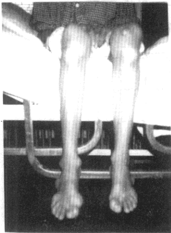
شکل ۲: زانتوماهای منتشر

نوع هموزیگوت، شیوع یک در یک میلیون دارد. این افراد به طور کلی فاقد رسپتورهای E و B می باشند. میزان کلسترول این افراد تا سطح ۷۰۰-۱۲۰۰ mg/dl نیز می رسد. علائم بالینی تنگی عروق کرونر معمولاً قبل از سن بیست سالگی بروز می کند و تقریباً همه این افراد دچار تنگی عروق کرونر می شوند و گاهی گزارش شده است که بعضی از بیماران در سن دو سالگی دچار انفارکتوس میوکارد شده اند. در معاینه فیزیکی این افراد معمولاً زانتوماهای پوستی (Cutaneous xantoma)، زانتوماهای تاندون (tendinous xanthoma) و قوس قرنیه (Corneal arcus) وجود دارد. گاهی زانتوما در داخل پلک چشم ها و داخل دهان بوجود می آید.