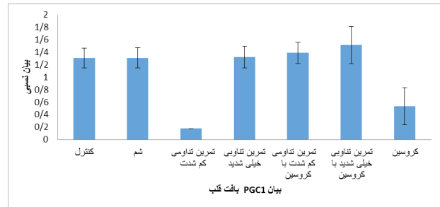
شکل ۱. مقادیر بیان ژن \alpha -PGC ۱ بافت قلب رت‌ها در هفت گروه پژوهش براساس تحلیل واریانس دو راهه

درباره آثار تعاملی، مطالعه حاضر نشان داد، هشت هفته تمرین‌های ورزشی همراه با مصرف کروسین سبب افزایش بیان ژن \alpha -PGC ۱ و UCP۱ رت‌های