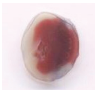
شکل ۱: ناحیه انفارکته شده میوکارد (رنگ زرد متمایل به سفید)

محلول اوانس بلو ۲ درصد از ورید وناکاوا ۱۴ تزریق شد تا ناحیه ایسکمی قرمز رنگ از ناحیه سالم آبی رنگ متمایز شود. در نهایت تحت بیهوشی عمیق، قلب حیوان از بدنش جدا شد و پس از سست‌وشو با آب مقطر و جدا کردن دلیلهای، ریشه عروق و ضامم اضافی آن، در داخل فویل آلومینیومی پیچیده و تا روز بعد در داخل فریزر قرار داده شد. پس از خارج کردن قلب از فریزر با کمک قالب‌های مدرجی، برش‌های یک میلی متری از بطن چپ (از قاعده به آپکس) تهیه شد. برش‌ها به مدت ۲۰ دقیقه در محلول تری فنیل تترازولیوم (TTC) ۱۵ در دمای ۳۷ درجه قرار داده شد و سپس برش‌های قلب به مدت ۲۴ ساعت در فرمالدهید (۱۰ درصد) قرار داده شد. تترازولیوم با عبور از دیواره سلولی و واکنش با آنزیم‌های دهیدروژناز درون سلولی در بافت ایسکمی (زنده) سبب می‌شد که این نواحی به رنگ قرمز تیره در بیاید. اما نواحی انفارکته به دلیل نکروزه شدن و از دست دادن آنزیم‌های دهیدروژناز درون سلولی نمی‌توانستند با تترازولیوم واکنش نشان دهند و به همین دلیل این نواحی به رنگ زرد متمایل به سفید در می‌آمدند. در انتها با استفاده از نرم‌افزار فتوشاپ نسبت ناحیه انفارکته شده به بطن چپ نمونه‌های اسکن شده، تحت عنوان اندازه انفارکتوس اندازه‌گیری شد (شکل شماره ۱).