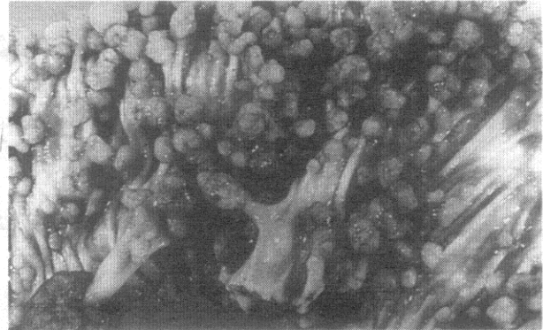
شکل ۱- پولیپوز آدنوماتوز روده بزرگ

صورت مشاهده خون روشن در مدفوع و دل‌پیچه شروع شد. طی بررسیهای انجام شده تشخیص پولیپوز فامیلیال کولون داده شد و یکسال پیش تحت عمل جراحی برداشتن کامل کولون قرار گرفت. (شکل ۱)