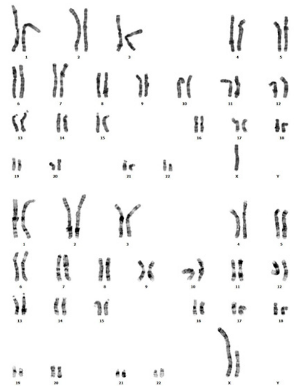
شکل دوم: کاریوتایپ مربوط به بیمار دوم (45, X ,dic X (40%) X ,dic X (60%) X ). این بیمار نیز به صورت موزائیک ترکیبی از سلول های حاوی یک کروموزوم X (تصویر بالا) و ایزودیستریک X (تصویر پایین) است.

بررسی همبستگی های ژنوتیپ- فنوتیپ در این بیماران نشان می دهد که فنوتیپ کامل این بیماری اغلب در بیماران با کاریوتایپ غیرموزائیک مشاهده شده و در بیماران با بازآرایی های کروموزوم X می توانند فنوتیپ کامل یا جزئی ترنر را نشان دهند. با این حال، به دلیل غیرفعال بودن ترجیحی X غیر طبیعی، ناهنجاری های مرتبط با نوع موزائیک به طور کلی تحمل شده و می توانند حداقل تا حدودی منجر به فنوتیپ شود (۹-۱۱).