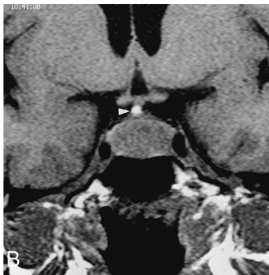
شکل ۱- T1-weighted MRI با یک ماکروآدنوم ۱۵ میلیمتری در اینفاندیبولوم هیپوفیز. A. نمای ساژیتال، B. نمای کرونال