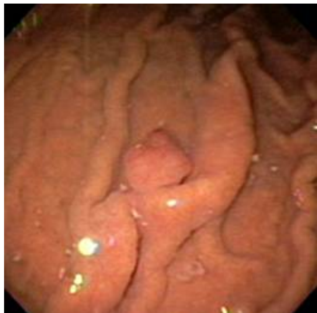
شکل ۱- نمای اندوسکوپی پولیپ پایه‌دار در دیواره قدامی فوندوس معده

معاینات بالینی معمول در این بیمار طبیعی بودند. فشار خون بیمار برابر ۱۳۰/۸۰ میلی‌متر جیوه و ضربان نبض او برابر ۸۰ در دقیقه بود. شکم بیمار در معاینه نرم و بدون هیچ گونه شواهدی از توده و یا بزرگی اعضاء بود. آزمایشات بالینی (شمارش کامل خون، آزمایشات عملکردی کبد و تیروئید و الکترولیت‌های سرمی) همگی در سطح طبیعی بودند. سونوگرافی شکم و لگن طبیعی بودند. کولونوسکوپی کامل انجام شد و نمونه‌هایی از کولون نیز تهیه گردید که البته تمامی آنها از نظر بافت شناسی طبیعی بودند.