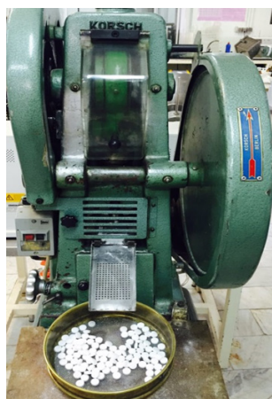
تصویر ۴. متراکم‌سازی قرص‌ها با ماشین قرص

میزان رفلکس تهوع پیش از مداخله و در زیرگروه خفیف، در گروه مورد ۱/۰/۶، در گروه پلی‌اسبو ۱۰/۸ و مورد ۱/۰/۸ بود و همین‌طور در زیر گروه متوسط به ترتیب ۱۵/۲، ۱۴/۸، ۱۵/۴ بود. سرانجام در زیر گروه شدید به ترتیب ۱۷/۶، ۱۸، ۱۷/۴ بود که اختلاف ناچیزی داشتند و این از لحاظ آماری معنادار نبود ( p < 0/9 ). میزان