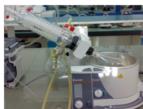
تصویر ۲. تغلیظ عصاره با دستگاه روتاری