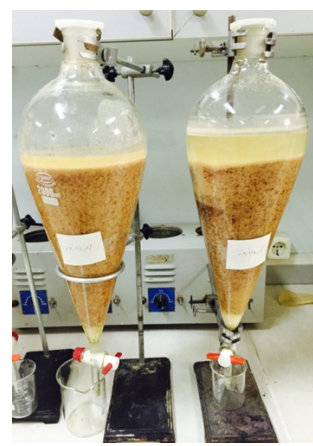
تصویر ۱. روش عصاره‌گیری پرکولیشن.

سپس برای انجام تست تانن، ماده موثره مورد نیاز، مقدار ۱gF عصاره الکلی را در ۲۵ml آب مقطر جوش حل کرده و به خوبی آن را مخلوط کردیم تا به حرارت آزمایشگاه برسد. ۴-۲ قطره محلول ۱۰ درصد کلرور سدیم به محلول سرد شده اضافه و به این وسیله ترکیب‌های غیر تانن رسوب داده شد. محلول صاف شده به مقادیر ۳ml در ۴ لوله آزمایش قرار داده شد. لوله یک به عنوان شاهد به کار برده شد. در لوله دو، مقدار ۴-۵ قطره محلول ۱ درصد ژلاتین، در لوله سه، ۴-۵ قطره ژلاتین نمک دار ریخته شد، در لوله چهار، ۴-۳ قطره محلول کلرور فریک